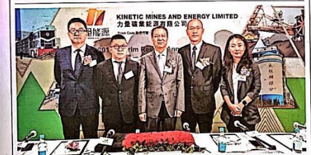
力量能源管理層成員合影。

中國領先及高效的綜合煤炭企業力量能源(01277 HK)公佈2019年中期業績。截至今年6月底止6個月錄得股東應占盈利約3.8億元人民幣，純利率為29.7%；每股盈利4.5分人民幣。由於現金流強勁，力量能源維持高派息政策，董事會建議向公司股東派付中期股息每股1.5港仙，與去年同期持平。