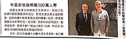
港銀控股管理層成員合影。

【本報訊】港銀控股(08162)宣佈在內地拓展教育管理業務，計劃在未來三年內，投資興建多間學校。港銀控股表示，其在內地教育管理業務的發展，主要是由於內地教育市場規模龐大，以及內地政府對教育事業的重視。