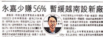
永嘉集團管理層成員合影。

【本報訊】永嘉集團公佈2019年中期業績，顯示其越南業務表現疲軟，虧損56%。由於越南市場競爭激烈，永嘉決定暫緩在越南設立新廠。此外，永嘉還指，其越南業務的虧損，主要是由於越南市場競爭激烈，以及越南政府對外國投資者的政策不明確。